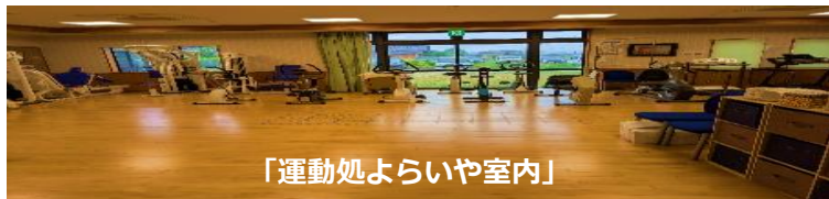
「運動処よらいや室内」