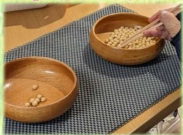
「6月の競技豆つかみチャレンジ」の様子です。

よらいやでは、マシン器具トレーニングや集団レッスンなどを行っていますが、時にはこのようなイベントを企画することにより、楽しみながらコミュニケーションが生まれます。この活力を日々の健康維持に繋げていくため、引き続き皆さんに楽しんでいただけるイベントを、たくさん企画してまいります。