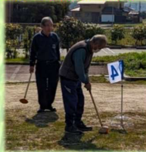
「11月の競技グランドゴルフ」様子です。