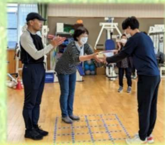
よらいや選手権「表彰式」の様子です。