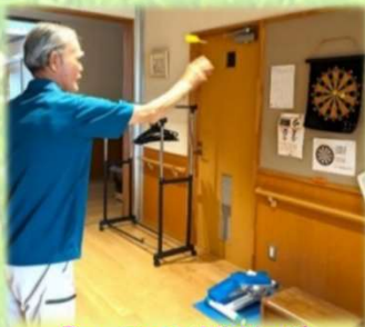
「7月の競技ダーツ」の様子です。